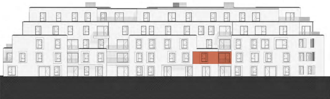
Rue des Mines